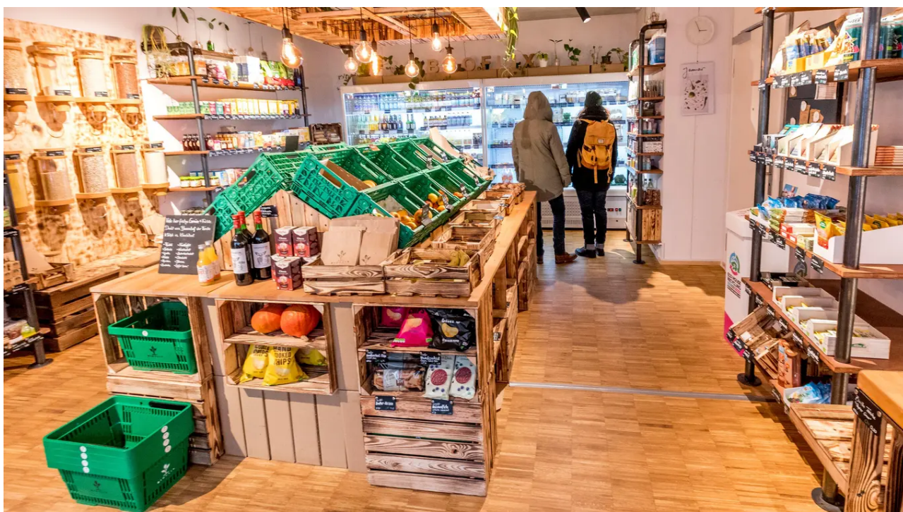
Bioprodukte, Gemüse und mehr: Bioflix-Laden in Basel.

Für alle anderen Läden gelten in Basel-Stadt weiterhin die «normalen» Öffnungszeiten: 6 bis 20 Uhr von Montag bis Freitag sowie 6 bis 18 Uhr am Samstag. Familienbetriebe können sieben Tage die Woche von 6 bis 22 Uhr geöffnet haben. Dazu zählen auch Coop-Pronto- oder Migrolino-Geschäfte, ebenso die Bioflix-Läden.